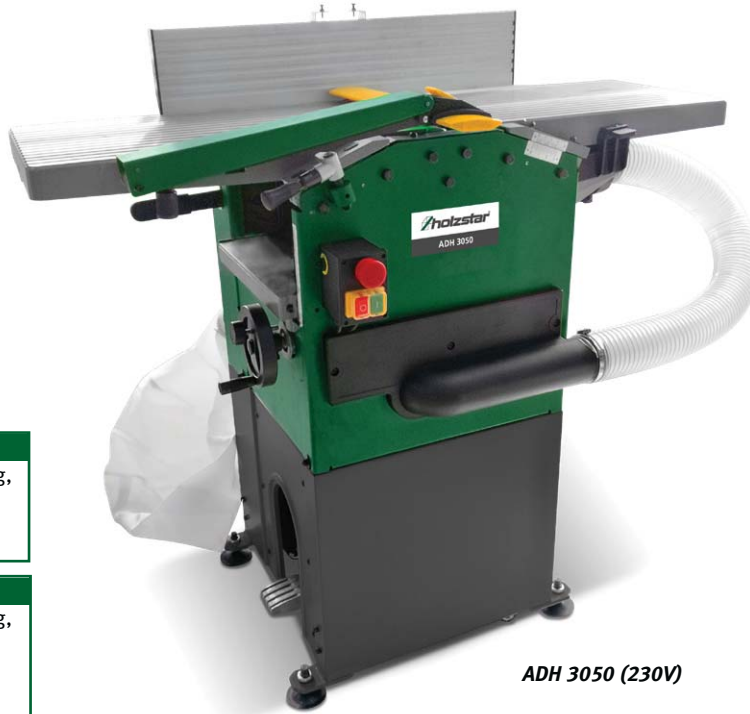
ADH 3050 (230V)