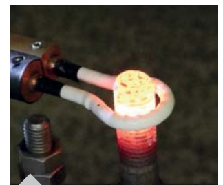
Erwärmen eines Gewindebolzens mit der wassergekühlten Spule