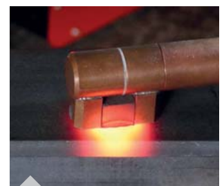
Erwärmen eines Bauteils mit der Fokusspule seitlich