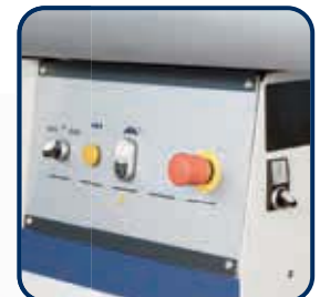
► Mit manueller Höhenverstellung und Schwenkung des Sägeaggregats per Handrad ► Zwei Schnittgeschwindigkeiten über Inverter schaltbar ► Zuschalten der Mikrosprühleinrichtung seitlich möglich