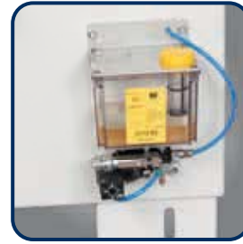
Mikrodosiergerät ► Mit extra großem Schmiermittelbehälter, frequenz geregelter Pumpe und Sprühkopf ► Getrennte Luft- und Sprühmittelführung, dadurch kein Nachtropfen