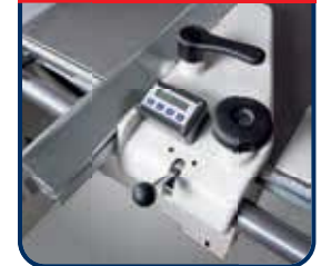
► Mit Digitalanzeige für die Schnittbreite am Parallelanschlag Art.-Nr.: 5516000