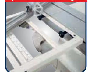
► Ausleger mit winkelverstellbarem Teleskop-Ablänganschlag ► Optional mit Gradrastereinteilung Art.-Nr.: 5510403