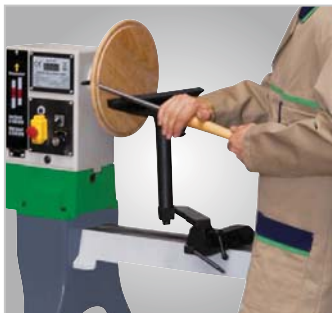
Für Drechselarbeiten an Werkstücken im Querholzbetrieb, die größer als das Stichmaß der Bank sind, kann der Spindelstock geschwenkt werden. Die optionale Bettverlängerung in Verbindung mit der umsteckbaren Handstahlaufgabe ermöglichen maximale Flexibilität.