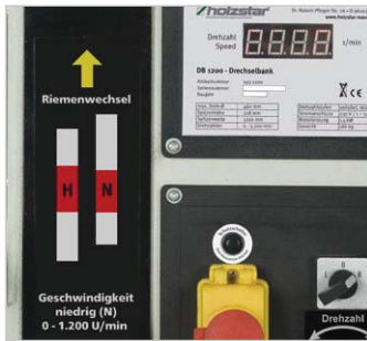
Variable Drehzahlregulierung von 0-1.200 min -1 (L) und 0-3.200 min -1 (H) in zwei Geschwindigkeitsstufen.