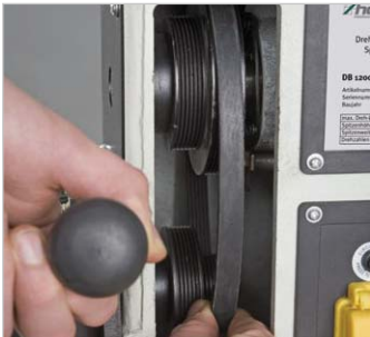
Werkzeugloses Wechseln der Übersetzungsstufe durch leichtes Ummontieren des Keilriemens