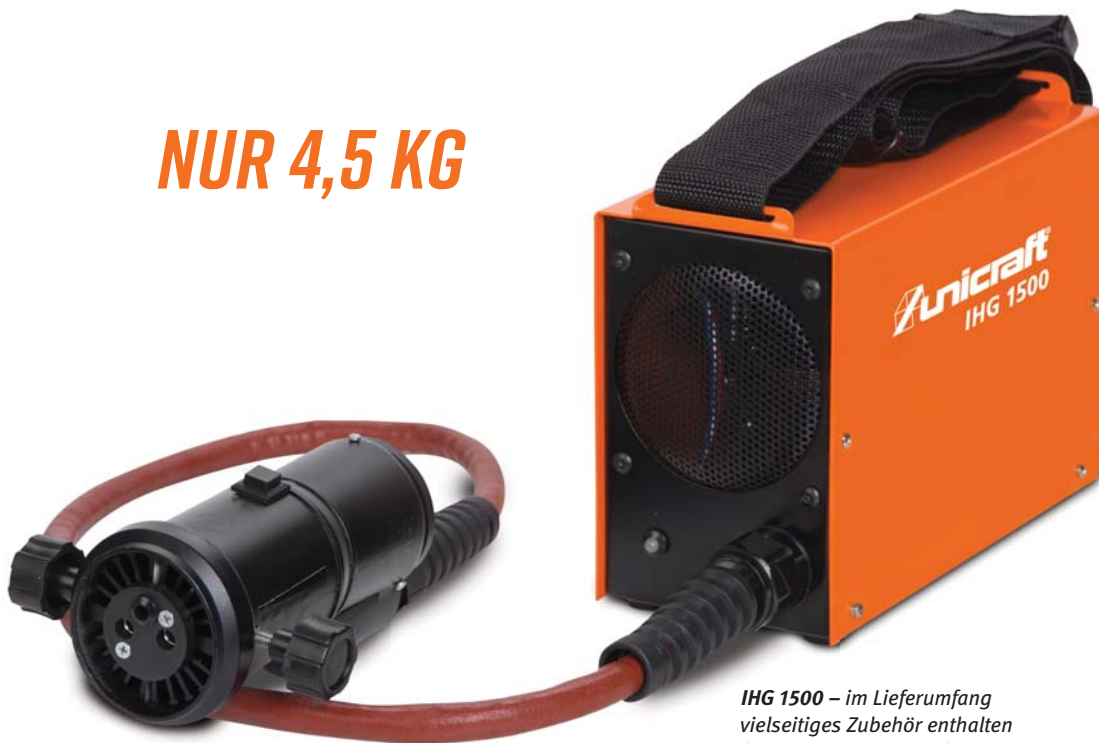
IHG 1500 – im Lieferumfang vielseitiges Zubehör enthalten (Abbildung unten links)