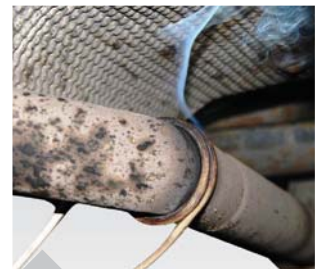
Zum Lösen von schwer zugänglichen Teilen durch den Einsatz von speziellem Wickeldraht